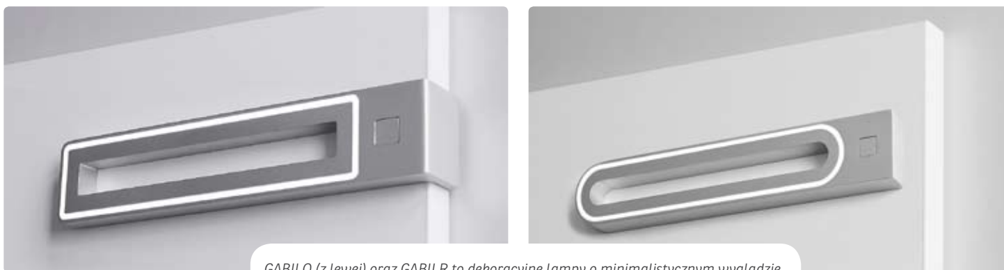
GABII Q (z lewej) oraz GABII R to dekoracyjne lampy o minimalistycznym wyglądzie.

Nowoczesny kształt, łatwość montażu i połączenie funkcji użytkowej z dekoracyjną to główne cechy oświetlenia FURNIKA .